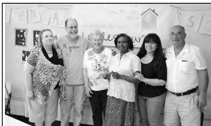
Les membres du Conseil d'administration actuel (de gauche à droite)

Le travail au sein du CA est partagé entre tous les administrateurs. Parmi les responsabilités qui sont assumées par les différents membres du CA, mentionnons la participation active à toutes les rencontres familiales (Fête de Noël, Sortie à la plage Saint-Zotique, Assemblée générale annu-